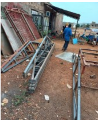
FABRICATION DE LA CHARPENTE A KITA