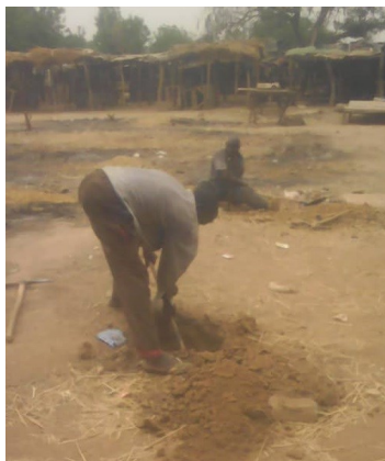
FONDATEMENTS EN COURS A BADINKO