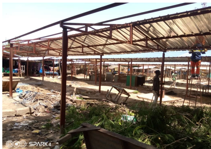
Travaux du marché: pose de la couverture

L'enthousiasme est toujours là au service de la SOLIDARITE