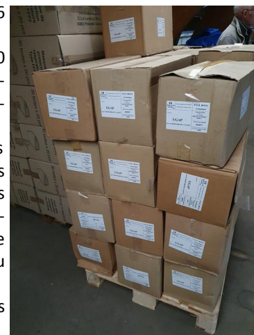
Palettes de masques dans l'entrepôt