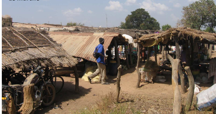
BADINKO Le marché

En Octobre, ce sont 18 tonnes de ferraille et métaux divers qui ont été vendus.