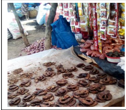
Vente de poissons séchés au Marché de Badinko – Avril 2018