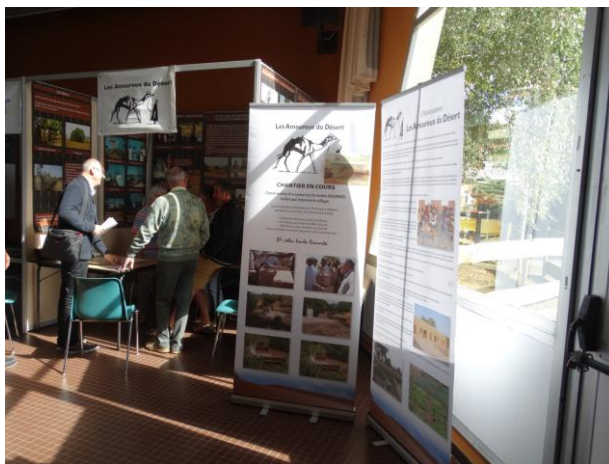
Le stand des Amoureux du Désert lors de l'édition 2017