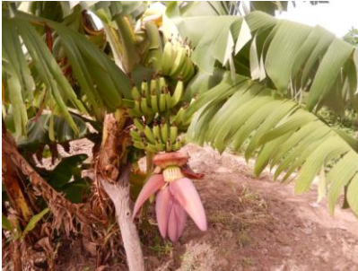
Au jardin communautaire, malgré une terre hostile, les femmes font des miracles.