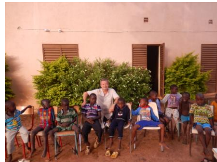
A la maison communautaire, même la verdure a poussé grâce à un arrosage journalier.