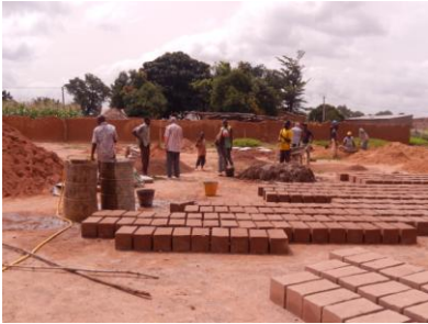
Fondation des trois nouvelles classes.