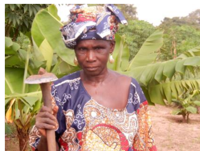
La terre du jardin communautaire est retournée avec cet outil (daba) que tient cette femme.