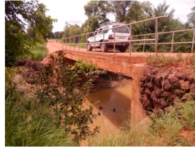
Sur le pont, ça roule un peu plus chaque jour.