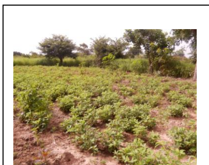
Au jardin communautaire de Badinko, cette année la récolte de pommes de terre s'annonce excellente !