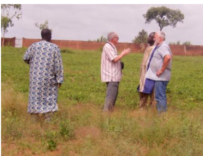
Aucun espace n'est perdu, le concierge du collège a profité des vacances pour y semer des arachides que les élèves récolteront le jour de la rentrée.