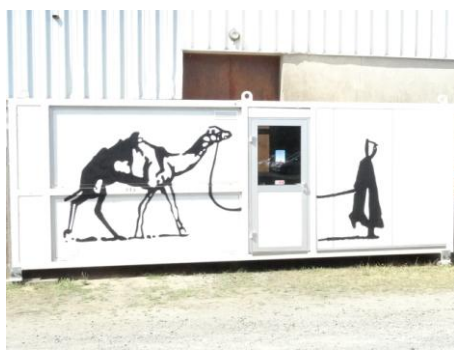
Depuis juillet 2017, l'équipe du jeudi à Clisson Déjeune dans la somptueuse salle de restauration ci-dessus.

Nous aurons besoin de beaucoup de bras, nous ferons appel en temps voulu.